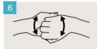
Frótese el dorso de los dedos de una mano contra la palma de la mano opuesta, manteniendo unidos los dedos.