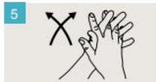
Frótese las palmas de las manos entre sí, con los dedos entrelazados.