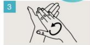
Frótese las palmas de las manos entre sí.