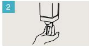
Aplique suficiente jabón para cubrir todas las superficies de las manos.