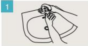
Mójese las manos.