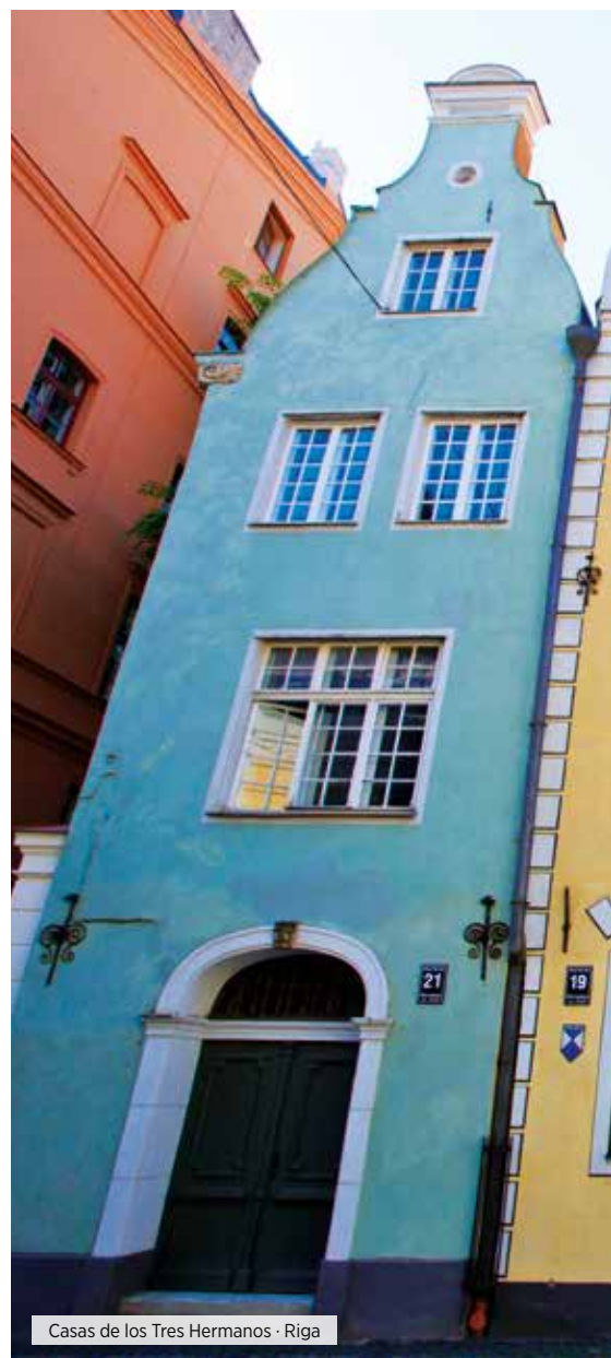
Casas de los Tres Hermanos · Riga

Desayuno. Salida hacia la costa báltica, deteniéndonos en Parnu. Tiempo libre para conocer Ruutli, principal calle peatonal de Parnu, con encantadores casitas típicamente estonias. Continuación el Parque Nacional de Gauja, donde realizaremos una parada en uno de los pueblos más antiguos de Letonia: Cesis. Su historia se remonta al año 1206 cuando "los Hermanos Livonios de la Espada" construyeron su castillo defensivo, en este lugar. Tiempo libre para dar un paseo por su casco antiguo con calles adoquinadas y sus dos castillos que perfectamente podrían estar incluidos en la lista de castillos más bonitos de Europa. Seguidamente nos dirigiremos a la Cueva de Gutmanis, a orillas del río Gauja y que es la mayor y más profunda gruta de la región del Báltico. Es origen de numerosos cuentos y leyendas. Podremos apreciar algunas pinturas e inscripciones que decoran las paredes y techos de la gruta. Continuación hacia Riga. Cena y alojamiento.