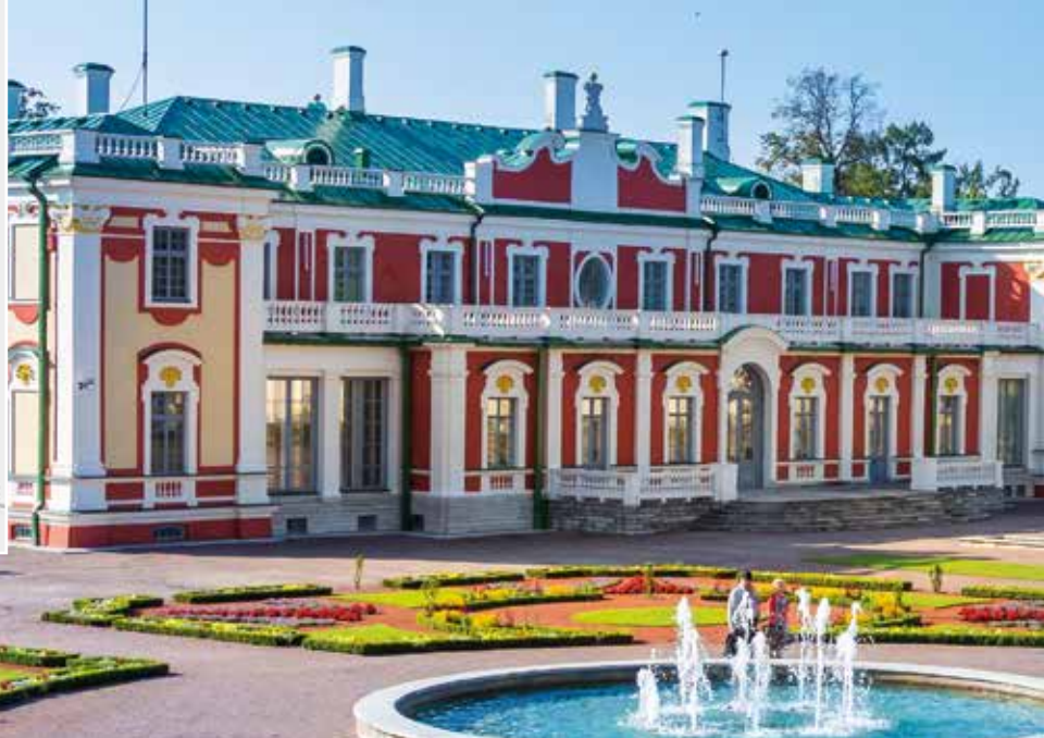
Palacio Kadriorg · Tallin