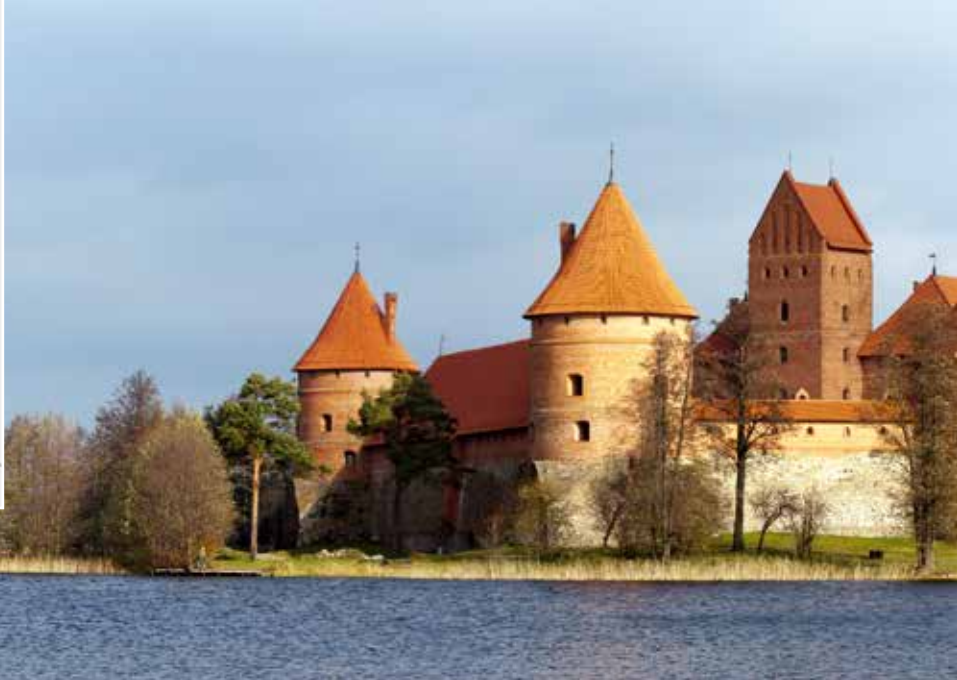
Vista de la fortaleza · Trakai