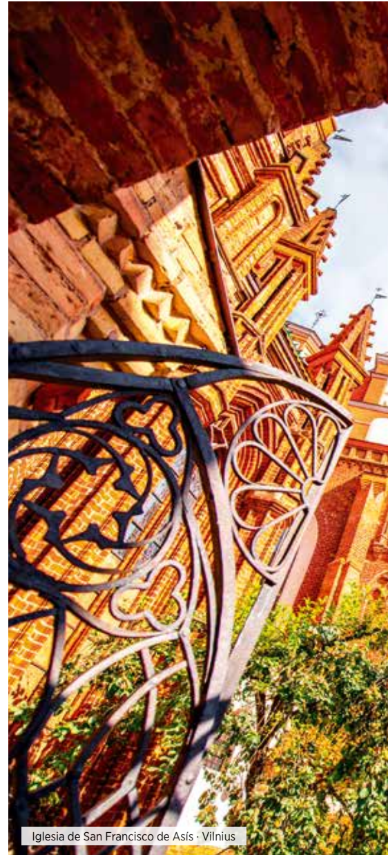
Iglesia de San Francisco de Asís · Vilnius

Desayuno. Día libre para seguir conociendo la ciudad, pudiendo aprovechar para pasear por su centro histórico, o si lo desea podrá realizar una interesantísima excursión opcional en la que nos dirigiremos hacia el Palacio de Rundale, uno de los más sobresalientes edificios del Barroco y Rococó letón, construido entre 1736 y 1740 como residencia de verano de Ernst Johann Byron, Duque de Courland. Cena y alojamiento.